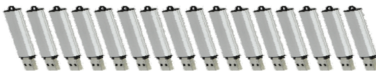
Archivage non durable: un téraoctet sous la forme de 16 clés USB (64 Go)

Cinq archives membres, à savoir les Archives d'Etat de AG, AR, BS et UR et les Archives de la Ville de Lucerne, souhaitent pouvoir bénéficier rapidement d'une solution commune d'enregistrement. Après s'être mis d'accord sur différentes questions encore ouvertes, ces Archives ont décidé de lancer rapidement un appel d'offres afin que ladite solution puisse être mise en service avant la fin de l'année.