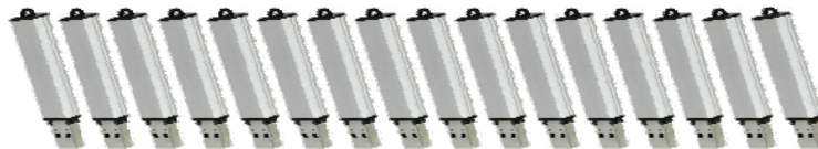
Kein archivtauglicher Speicher: 1 TB in Form von 16 USB Memory Sticks (64 GB)

Fünf Mitgliedsarchive – die Staatsarchive AG, AR, BS und UR sowie das Stadtarchiv Luzern – sind unmittelbar an der Nutzung einer gemeinsamen Speicherlösung interes- siert. Nach der Konsensfindung über einige noch offene Fragen wird diese Lösung zü- glich ausgeschrieben, so dass sie noch in diesem Jahr in Betrieb genommen werden kann.